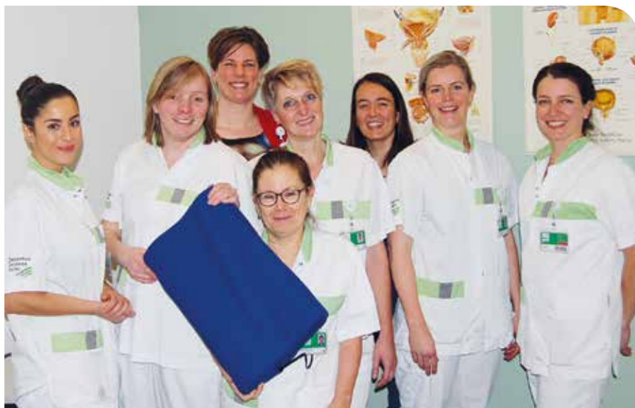
MEDEWERKERS VAN DE POLIKLINIEK UROLOGIE VAN ZIEKENHUIS GELDERSE VALLEI

Het muziekkussen wordt onder andere ingezet bij de transrectale echogeleide prostaatbiopsie. Door het luisteren naar rustgevende muziek tijdens de behandeling wordt de aandacht van de patiënt afgeleid van de pijn en stress. Hierdoor kan het zijn dat de patiënt de ingreep als minder pijnlijk ervaart. ●